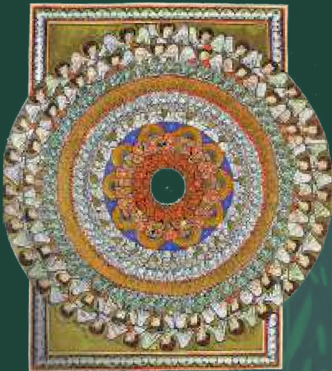
„Chor der Engel“ aus Scivias I.6, Rupertsberger Codex fol. 38r